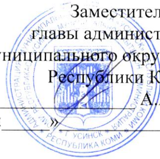
График проведения управлением территориального развития, экологии и природопользования в январе 2024 г. общественных обсуждений